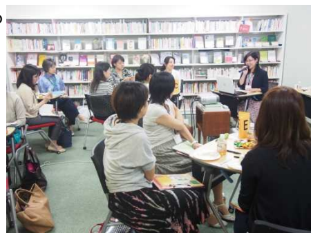
キャリアサロン第4夜(2013.7)にて