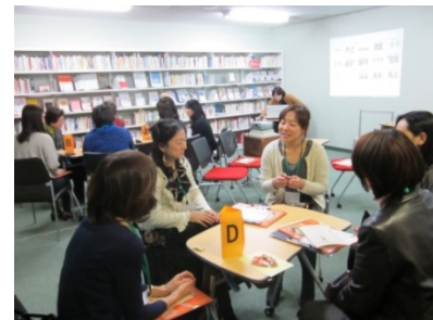
キャリアサロン第3夜(2013.2)にて