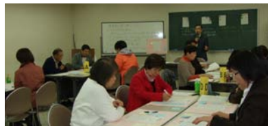
(2) 水戸市男女平等参画推進課との共催