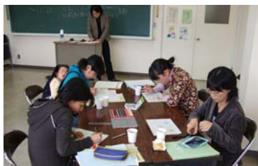
(1)須坂市男女共同参画課との共催