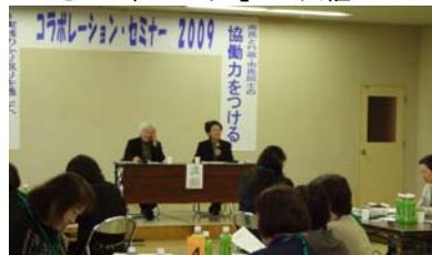
(1)男女平等参画をすすめる会「えんぱわーメイト」との共催