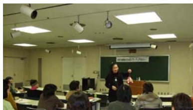
(2) もりおか女性センターとの共催