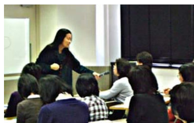
(3)藤沢市教育委員会との共催(公開講座)