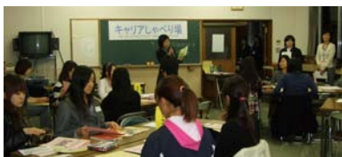
(1) 聖心女子大学キャリアセンターとの共催