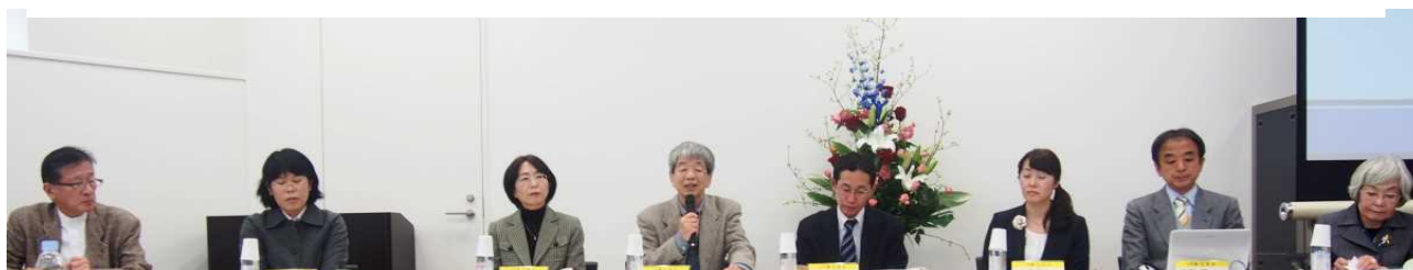
昨年度パネルフォーラム風景

活動や学び、歩いてきた道を男女共同参画の視点で振り返ったレポートを募集・表彰する「日本女性学習財団賞」。今年度受賞レポートをもとに、パネルフォーラムを開催します。受賞者によるレポート発表、選考委員と受賞者のディスカッションなど、もりだくさんのプログラム。どうぞ参加ください。